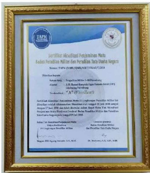
Sertifikat Akreditasi Penjaminan Mutu Tahun 2018