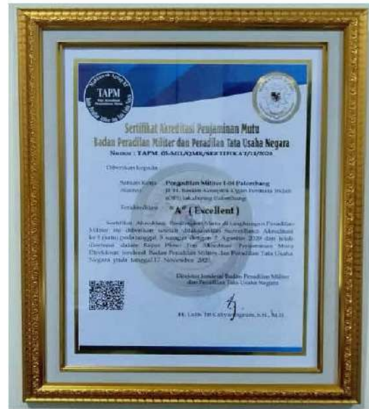
Sertifikat Akreditasi Penjaminan Mutu Tahun 2020